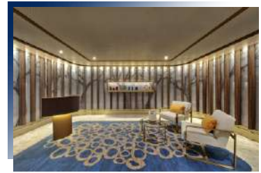
SPA & Wellness & Fitness Center (Deck 7)

多功能全方位的交誼廳，這裡有服務台，咖啡吧，專業的咖啡師提供香醇現煮咖啡，全天供應糕點、三明治、冰淇淋等，這裡也有圖書館與資訊中心。