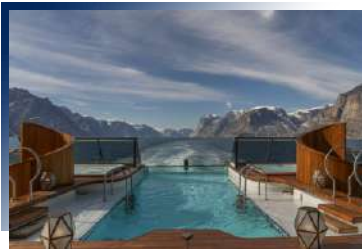
Infinity Pool (Deck 5)