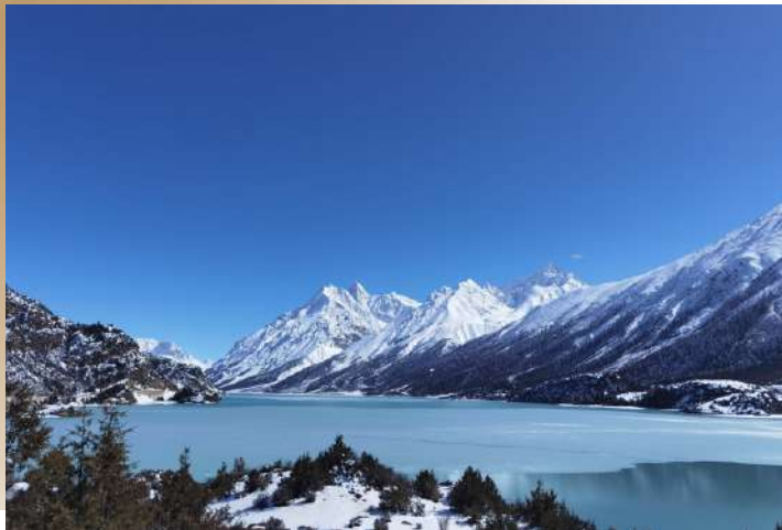
雪域遺落的藍寶石