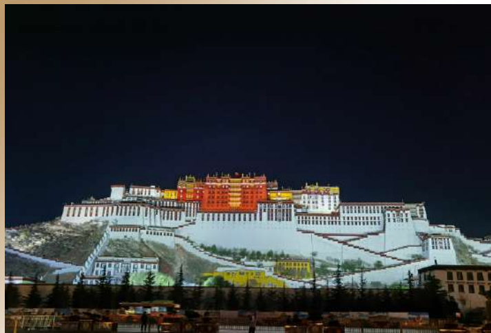
懸浮在時間褶皺中的雪域聖殿