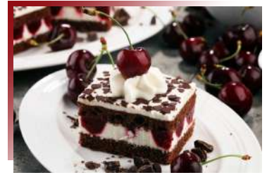
政府立法規定配方的傳統甜點 黑森林蛋糕

位於德法邊境的亞爾薩斯區，百餘年間被更迭政權統治數次，因此無論建築風格、文化，甚至飲食，皆發展出獨特性。鴨子於法菜中有多種變化，無論是油封鴨或是煎鴨胸，在法國小鎮，以浪漫氛圍相隨，一嚐箇中滋味！