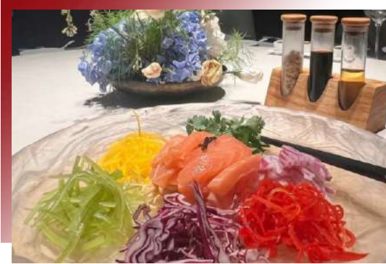
風聲水起撈三文魚