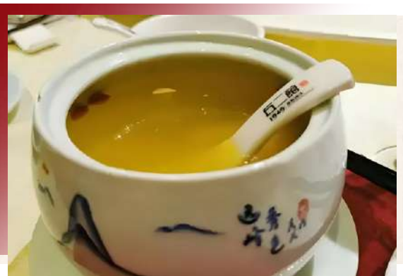
主打川粵融合創意菜

源自清宮御膳的百年美味。丘二館燉雞湯，憑藉其清澈油黃的湯色與酥軟鮮香的雞肉，屢獲「中華名小吃」等殊榮，其傳統技藝更被列入重慶市非物質文化遺產名錄。