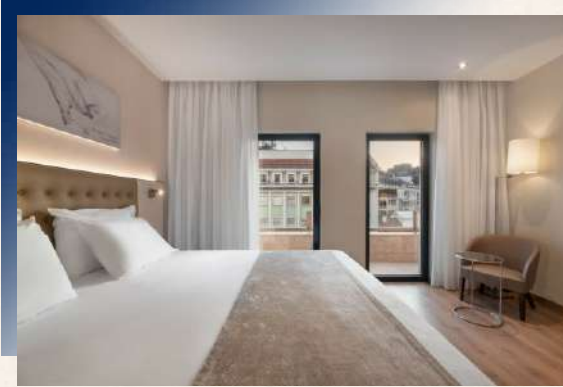
靜謐優雅的住宿空間，沐浴在古典與詩意之中 馬德里精選五星飯店

無論是古城中的歷史旅館，或現代設計的城市寓所，皆讓身心安頓、步調從容，讓旅程輕盈優雅，處處皆風景。