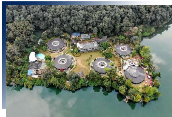
Fish Tail Lodge by Annapurna 5★ 或同級

入住位置絕佳特色住宿，盡情探索日夜風華。親選的山屋房間，為您極盡所能挑剔出最舒適的！