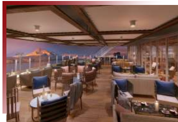
Sky Bar (Deck 9)

在郵輪緩慢前行的夜裡，晚餐提供的這一口壽司與生魚片，像是海洋送來的禮物，靜靜調劑旅途的味蕾，也為心情添上一抹優雅而溫柔之光。