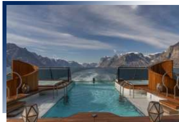
Infinity Pool (Deck 5)

多功能全方位的交誼廳，這裡有服務台，咖啡吧，專業的咖啡師提供香醇現煮咖啡，全天供應糕點、三明治、冰淇淋等，這裡也有圖書館與資訊中心。