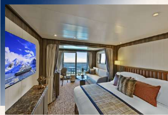
Veranda Suite (Deck 8-V4與Deck 6-V3)

搭乘豪華的五星級極地探險遊輪，132間設施齊全，配有全景觀露台的房間，展開圓夢追夢之旅。私人陽台即可觀賞南極的壯美景色