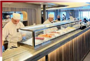
Sushi in the Club (Deck 9)