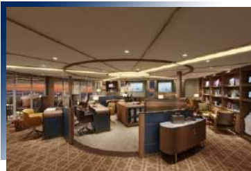
Seabourn Square (Deck 6)