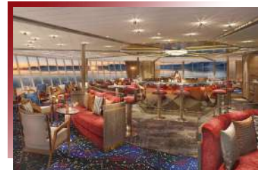
Constellation Lounge (Deck 9)

包括葡萄酒、啤酒、香檳、烈酒、礦泉水、調酒、特調飲品、咖啡、茶等。(不包含部分高級酒精飲品)，這裡是交換彼此每日探險心得感想的理想場所！