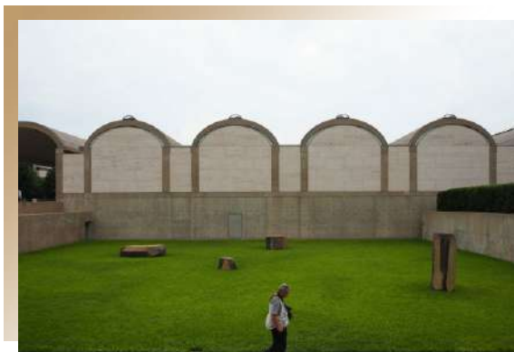
Kimbell Art Museum (Louis Kahn)