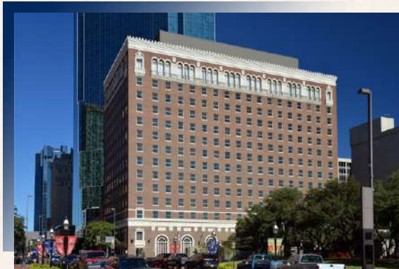
Hilton Fort Worth ★★★★★ 或同級