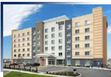
Fairfield by Marriott Inn & Suites North Bergen ★★★★★ 或同級

酒店位於僅距離洛杉磯市中心約10英里的華人社區附近，臨近熱鬧的商業街，購物、閒逛超方便，各種潮牌、特色小店應有盡有。