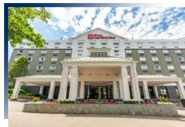
Hilton Garden Inn Boston Waltham ★★★★★ 或同級

酒店坐落在哈德遜河沿岸，能一覽無餘地欣賞到標誌性的紐約市天際線。156間客房設計時尚現代，並提供室內游泳池及24小時免費健身中心，酒店更是LEED綠建築認證候選，亦為環保和永續性方面做出努力。