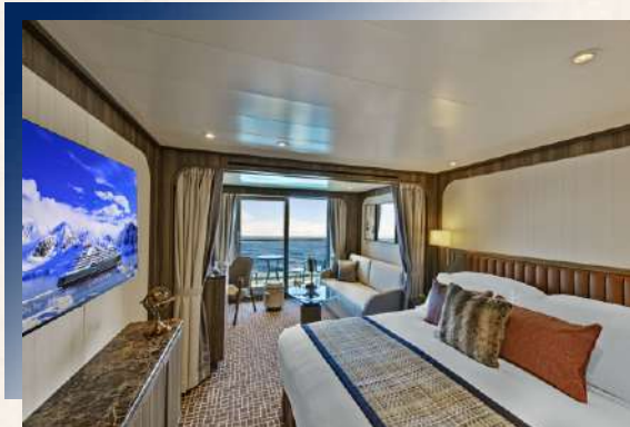
Veranda Suite (Deck 8 - V4)

搭乘豪華的五星級極地探險遊輪，132間設施齊全，配有全景觀露台的房間，展開圓夢追夢之旅。私人陽台即可觀賞南極的壯美景色