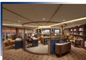
Seabourn Square (Deck 6)

船上配有4個露天溫水按摩浴池與1個露天無邊際泳池，這個戶外區域舒適且有利於放鬆，四周環境融入了大海和地平線，觸目所及皆是極地壯麗的風景。