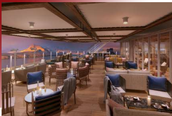
Constellation Lounge (Deck 9)

包括葡萄酒、啤酒、香檳、烈酒、礦泉水、調酒、特調飲品、咖啡、茶等。(不包含部分高級酒精飲品)，這裡是交換彼此每日探險心得感想的理想場所！