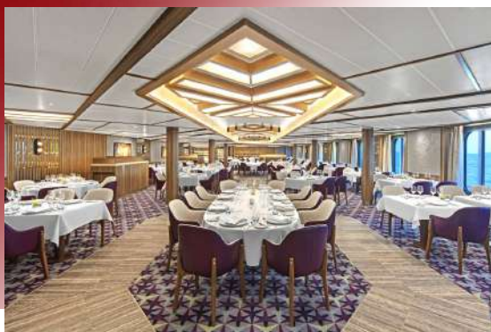
The Restaurant (Deck 4)

船上規劃有兩家餐廳，包括Buffet形式餐廳及需穿著合宜服裝用餐的主餐廳，旅客不需要預約就能自由入座，想吃什麼料理隨心所欲，甚至一次吃兩家都沒有問題！主餐廳提供早/午/晚餐，餐點選擇以牛排、義大利麵等西餐為主，座位：264席