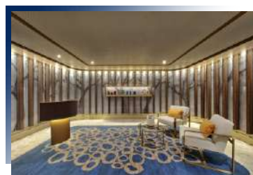
SPA &amp; Wellness &amp; Fitness Center (Deck 7)

多功能全方位的交誼廳，這裡有服務台，咖啡吧，專業的咖啡師提供香醇現煮咖啡，全天供應糕點、三明治、冰淇淋等，這裡也有圖書館與資訊中心。