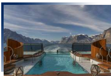
Infinity Pool (Deck 5)