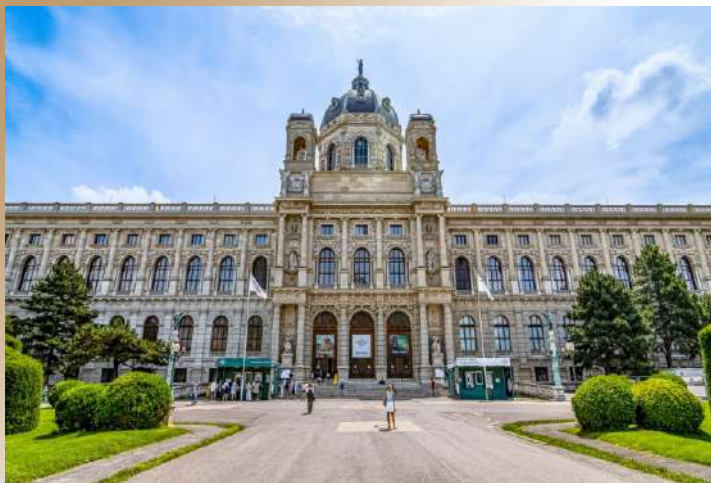
Kunsthistorisches Museum Vienna