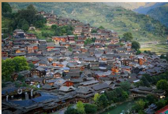
俯瞰1300餘棟吊腳樓全景