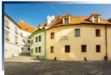
將童話小鎮的晨昏風景盡收眼底

座落於哈修塔特湖畔，四周環繞阿爾卑斯群峰。度假村以典雅木屋設計，融合自然風情與現代舒適。設施齊全，氛圍靜謐悠然，讓旅人沉浸湖光山色，盡享輕鬆愜意的度假時光。