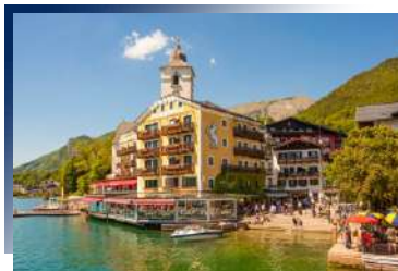
白馬飯店，聖沃夫岡百年傳奇名宿