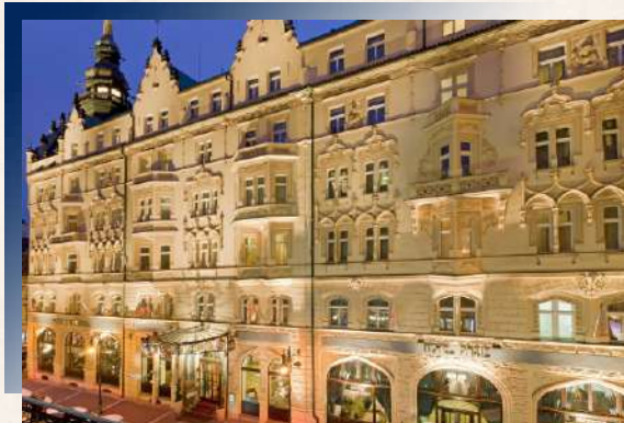
舊城廣場旁的新藝術瑰寶