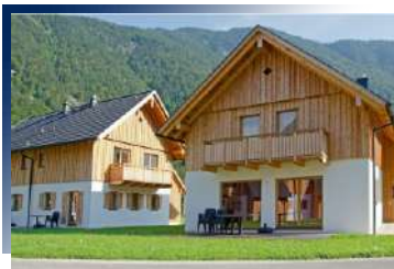
擁抱阿爾卑斯懷抱的夢幻木屋度假天堂

位於聖沃夫岡湖畔，擁有數百年歷史，因歌劇《白馬客棧》而聞名。融合傳統與現代設計，設有湖景餐廳與溫泉泳池，讓旅人於童話氛圍中盡享尊榮體驗。