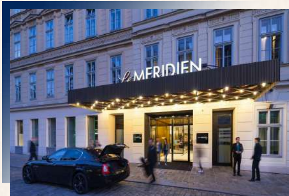
Hotel Le Meridien ★★★★★ 或 InterContinental Vienna ★★★★★