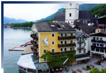
Hotel Weisses Rossl am Wolfgangsee ★★★★★

安排連續入住城內精華區五星級飯店二晚，知名景點皆於步行可達距離，絕佳位置亦滿足喜愛逛街購物的您，櫛比鱗次的商家，不論是紀念品、流行品牌等皆可輕鬆往返。