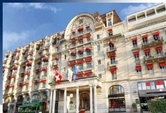
ROMANTIC HOTEL SCHWEIZERHOF GRINDELWALD ★★★★★ 或同級

洛桑皇宮酒店自1915年起，即是日內瓦湖畔的地標。酒店歷經百年歲月洗禮，融合深厚歷史與國際開放氛圍，熱情款待全球旅客。其不僅坐擁湖區美景，更紮根於奧林匹克之都的活力核心，為您提供獨特體驗，盡享洛桑豐富的文化與生活藝術。