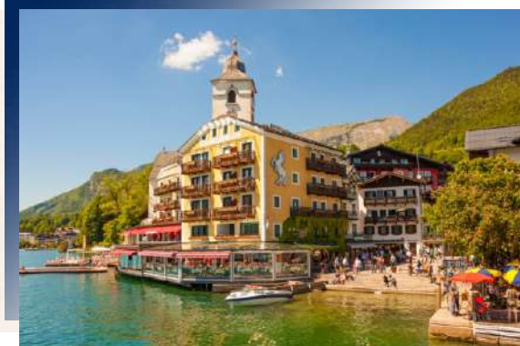
Seehotel Gruner Baum ★★★★★ 或同級 人間仙境－「哈斯塔特」

傳奇白馬飯店-位於阿爾卑斯山腳下的薩茲卡瑪古區的四大湖區最北岸湖濱小鎮，因「沃夫岡聖人」而得名。臨湖而建的木製小屋，繪製成湖景與天藍共成一色，景緻如畫讓人捨不得閉眼。