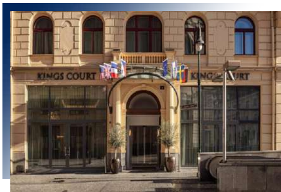
Hotel KINGS COURT ★★★★★或同級