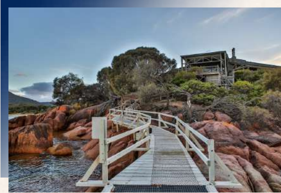
Freycinet Lodge 4*