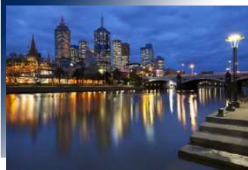
Pan Pacific Hotel 5*或同級 墨爾本市區五星連泊

特別安排墨爾本市區五星飯店連泊，方便您夜晚自由前往美麗的亞拉河畔、市區漫步參觀，感受澳洲藝文之都，國際大都會的日夜氛圍。