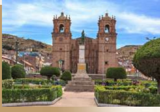
普諾大教堂 Puno Cathedral

普諾大教堂是巴洛克式天主教堂，建於18世紀。是市內最大的教堂。廣場中間有一座噴水池，還有一座非常有名的將軍 Don Francisco Bolognesi的雕像。而他是秘魯的民族英雄。