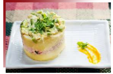
Causa de Atún

秘魯政府將這道菜命為秘魯國菜，新鮮白肉魚以檸檬汁醃漬，佐以牛番茄、玉米、洋蔥等配菜，再搭上少許芫荽、辣椒粉綴飾，口味酸辣清爽，令人食指大動！