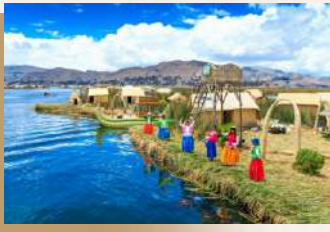
蘆葦島 Islas de Uros

幾百年前，玻利維亞的一群原住民—烏洛族(Uro)為了躲避印加人的逼迫，逃到的的喀喀湖中，住在以蘆葦建造的浮島上，一直與外界隔絕，直到近代為秘魯領土之一，不過由於文化差異太大，仍保持著自治區的方式，浮島居民共有約2000人。