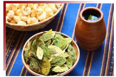
Mate de Coca

印加神獸羊駝(Alpaca)，對我們來說是療癒系萌寵的羊駝，對秘魯人來說，就是一隻隻「會走路的黃金」。其毛料保暖與透氣度皆媲美喀什米爾羊毛，更被譽為世上頂級毛料之一，就連口感介於牛肉與羊肉之間的羊駝肉也被視為餐桌上的美味。