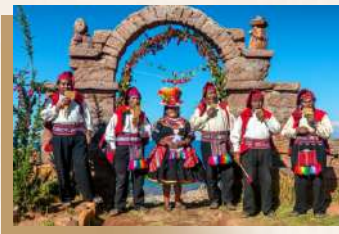
塔吉利島 Taquile Island

塔吉利島是的的喀喀湖位於秘魯國境內的一個島嶼，距離普諾市 45 公里。上的居民以其精美的手工編織紡織品和服裝而聞名全國，被認為是秘魯最美、最優美的手工藝品之一，非常特別的是，男性也從事紡織，而且每位男孩從小時候就開始學習這項技能。