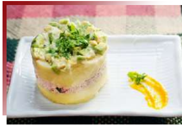
Causa de Atún

印加神獸羊駝(Alpaca)，對我們來說是療癒系萌寵的羊駝，對秘魯人來說，就是一隻「會走路的黃金」。其毛料保暖與透氣度皆媲美喀什米爾羊毛，更被譽為世上頂級毛料之一，就連口感介於牛肉與羊肉之間的羊駝肉也被視為餐桌上的美味。