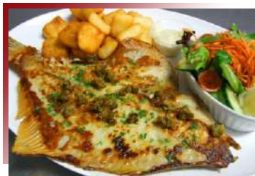
在地推薦餐廳鮮魚料理

瑪格麗特河區域出產葡萄酒雖僅約50年，但其品質廣受讚譽。以赤霞珠和霞多麗品種馳名，於風景優美的酒莊，品味優質美酒和享用主廚以當令食材入菜的料理。