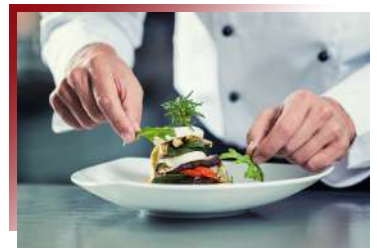
舒適放鬆的用餐體驗

在歷史悠久的當地知名海景餐廳，大啖撒上誘人佐料，現烤出爐的鮮魚料理，搭配馬鈴薯和生菜沙拉，是最道地的英式吃法。