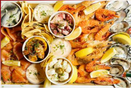
澎湃鮮甜的海鮮料理