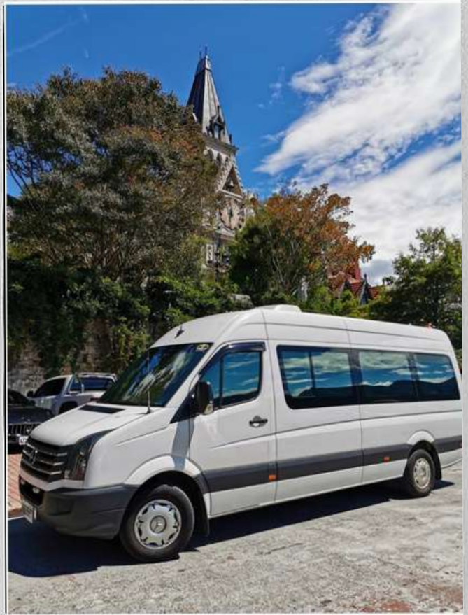
全程使用大T褌姆車

全程使用大T褌姆車陸上頭等艙九人座(團員最多坐7人)，讓您整趟旅程坐得舒適；並由專業資深且長期載客駕駛經驗司機服務，讓您快快樂樂出門，平平安安回家(每車內裝略有不同，以當日實際出車為主)。