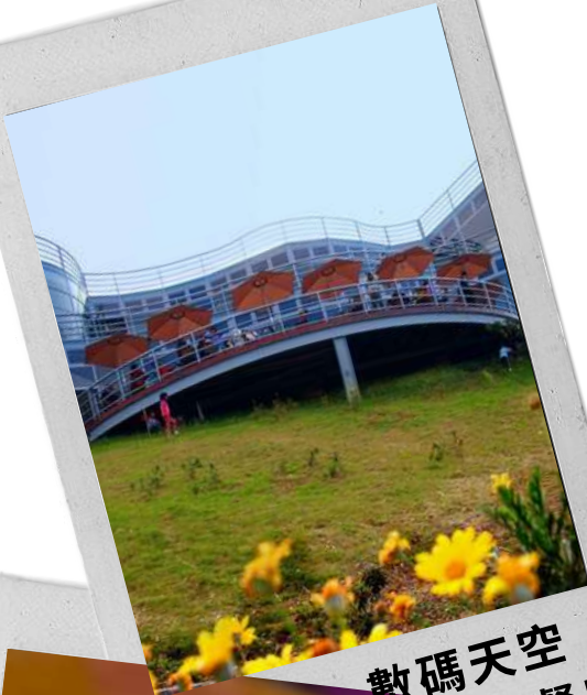
數碼天空 玻璃景觀餐廳