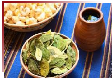
Mate de Coca

印加神獸羊駝(Alpaca)，對我們來說是療癒系萌寵的羊駝，對秘魯人來說，就是一隻「會走路的黃金」。其毛料保暖與透氣度皆媲美喀什米爾羊毛，更被譽為世上頂級毛料之一，就連口感介於牛肉與羊肉之間的羊駝肉也被視為餐桌上的美味。