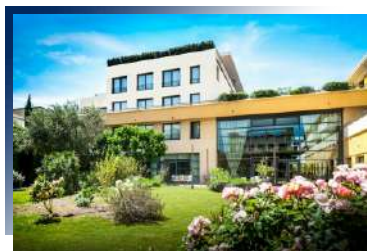
Avignon Grand Hotel ★★★★★ 或同級