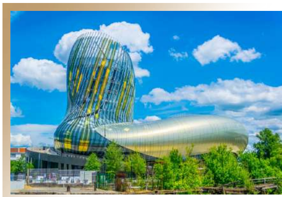
葡萄酒聖殿 Cité du Vin 波爾多葡萄酒博物館

悠遊蔚藍海岸、摩納哥、普羅旺斯山城、法 西南方獨特景致、羅亞爾河古堡區、經典巴 黎連3泊