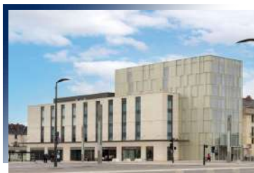
Hilton Garden Inn Tours Centre★★★★★ 或同級

飯店有個美麗的花園，距離中央車站僅2分鐘步程，離教皇宮有 15 分鐘的步行路程，美麗的浴室內備有歐舒丹普羅旺斯的用品供使用喔。