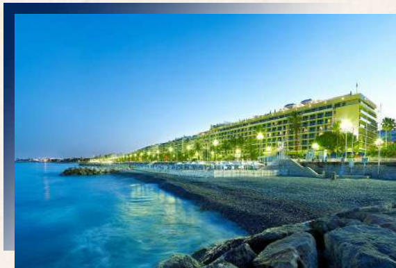
Radisson Blu Nice ★★★★★ 或同級