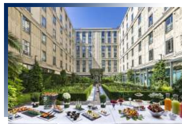
Hotel du Collectionneur ★★★★★ 或同級

坐落在羅瓦爾河谷的中心，周圍遍布商店、劇院和餐廳。羅瓦爾河谷的幾座城堡距離不到一小時車程。