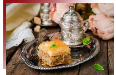
指標性傳統美食 宮廷第一滋味

由蘇丹古老的地下水宮改建而成，恢弘大氣、裝飾華美，提供土耳其精緻料理，來到伊斯坦堡絕對不能錯過的華麗饗宴。