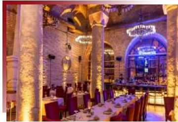
氣派隱密，低調奢華味蕾饗宴

香格里拉酒店的經典香宮中餐餐廳，伊斯坦堡頂級五星中式料理規格，菜色美味佳餚、氛圍奢華大器，外國的中式料理也可以吃得很舒適道地。