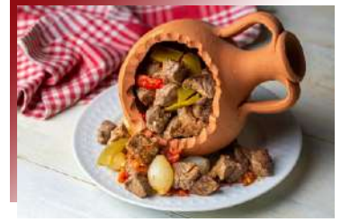
味道濃郁 挑戰味蕾

土耳其傳統早餐是開始美好一天的最好方式，通常包括雞蛋、當季蔬果、各種當地乳酪、橄欖與麵包，搭配新鮮食材製成的果醬與不可缺少的紅茶，種類繁多味道清爽，悠閒與親友一起分享、閒談及品嚐美食的概念，不只是早餐，更是一種體驗。