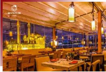
創意料理景觀餐廳

融合中東與地中海口味的土耳其菜，與法國菜、中國菜稱「世界三菜系」，品嚐異國風味的料理，感受旅遊的味覺體驗。