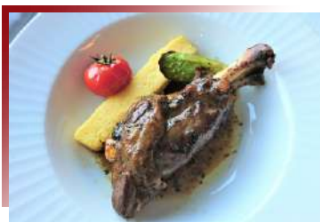
噴香多汁、大口吃肉

各國對小牛的成長週期略有不同，法國人則是會為了避免牛隻長大後某些部位便會消失吃不到或過老不好吃而提前屠宰。