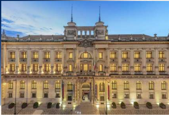
Hotel Paris Prague ★★★★★ 或 Hotel NH Collection Prague Carlo IV ★★★★★