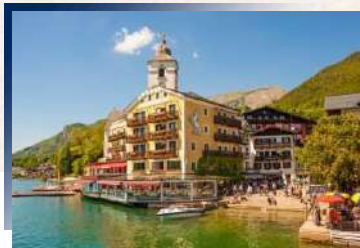
Hotel Weisses Rossl am Wolfgangsee ★★★★★

哈斯塔特的美，不該讓您只是到此一遊；特別安排入住哈斯塔特小鎮上，讓您放下行囊、停下腳步，細細品味絕美小鎮的迷人魅力，感受人間仙境之中的日與夜。