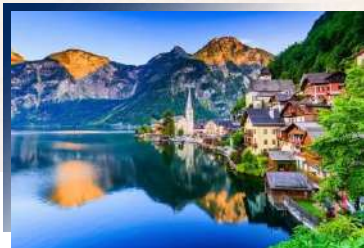
Seehotel Gruner Baum ★★★★★