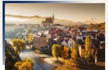
Hotel Zlatý Anděl ★★★★★ 或 Hotel OLDINN ★★★★★

位於阿爾卑斯山腳下的薩茲卡瑪古區的四大湖區最北岸湖濱小鎮，因「沃夫崗聖人」而得名。臨湖而建的木製小屋，繪製成湖景與天藍共成一色，景緻如畫讓人捨不得閉眼。