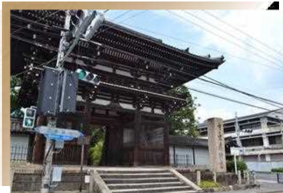
京都最古老的佛寺