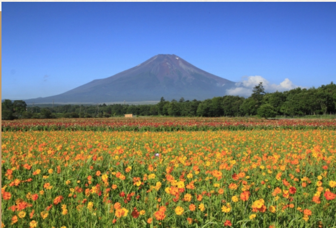
富士山 Mount Fuji