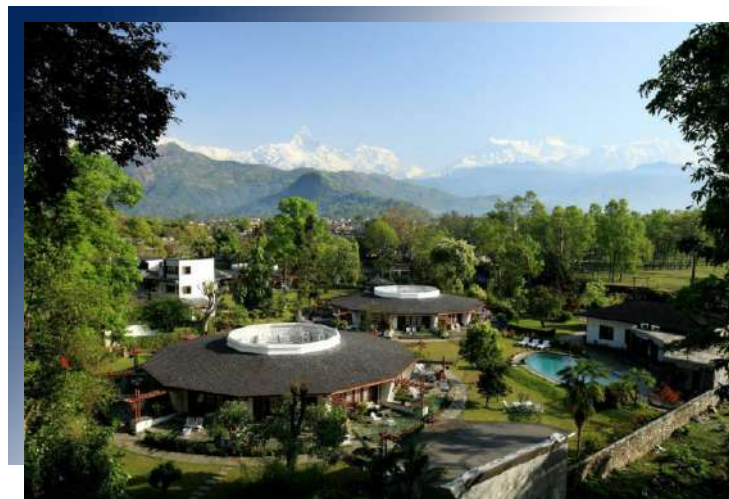
Fish Tail Lodge by Annapurna 5★ 或同級