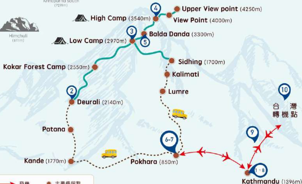
Mardi Himal 聖山魚尾峰 海拔高度圖