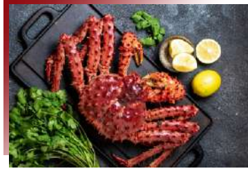
產地直送的珍饈美食 庫頁島帝王蟹

海參崴位於中、朝、俄三國交界處，多元文化融合下形成了獨樹一格的料理特色，行程特別帶您來品嚐海參崴的遠東料理，讓您一次嘗盡三國的美味。