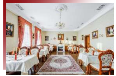
用餐也是一種享受 俄式貴族餐廳

布里亞特餃子最大特點在於餃子皮在捏褶子收口時，不將其收緊捏扭，而是留個小口，蒸的過程中餡的鮮香便瀰漫出來。