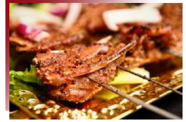
不可錯過的美味 蒙古石板羊肉

庫頁島位於寒冷的北方，得天獨厚的地理位置帶來了豐富的海洋資源。行程安排享用庫頁島帝王蟹，肉質鮮甜，絕對令您回味無窮。