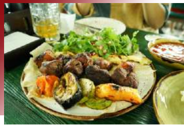
融合中/朝/俄三國風味 海參崴遠東料理

海參崴位於中、朝、俄三國交界處，多元文化融合下形成了獨樹一格的料理特色，行程特別帶您來品嚐海參崴的遠東料理，讓您一次嘗盡三國的美味。