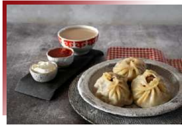
似曾相似的美味 布里亞特風味料理

俄式鮮魚湯一般以新鮮鱸魚、鱒魚、鮭魚為主，並佐以土豆和香菜，在寒冷的天氣，喝上一碗熱呼呼的鮮魚湯，感受最「俄式」的溫暖。