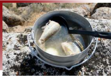
新鮮現煮美味上桌 俄式鮮魚湯

以黑炭燒烤，石板將軟嫩的羊肉烤至香氣併發、鮮嫩多汁，佐以各式香料，是來蒙古必嚐的經典美食。