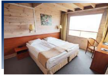
Baikai view Hotel或同級

入住烏蘭巴托最奢華的五星級大酒店，位居最繁華的地段，徒步即能抵達成吉思汗廣場及各大使館。飯店尊貴的裝潢融合了現代及蒙古當地特色。