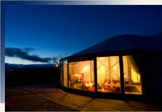
HS Khaan Resort Hotel或同級