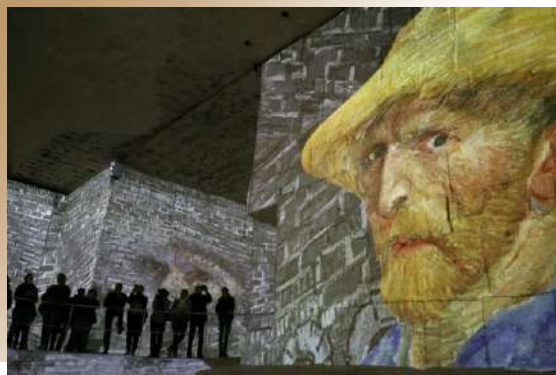
Carrières de Lumières