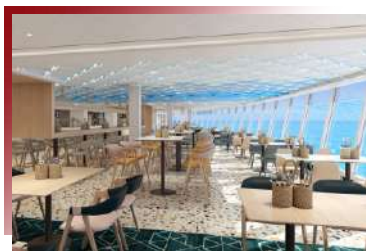
Surfside Café & Grill