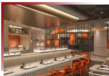
Nama Sushi & Sashimi