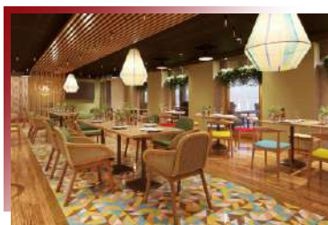
The Local Bar & Grill