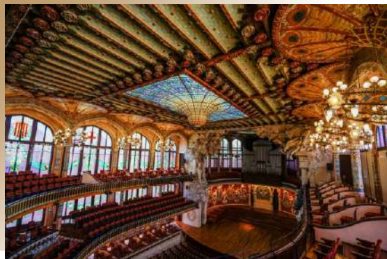
Palau de la Música Catalana