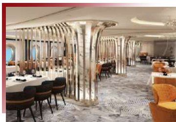
The Commodore Room