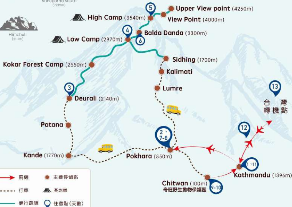
Mardi Himal 聖山魚尾峰 海拔高度圖