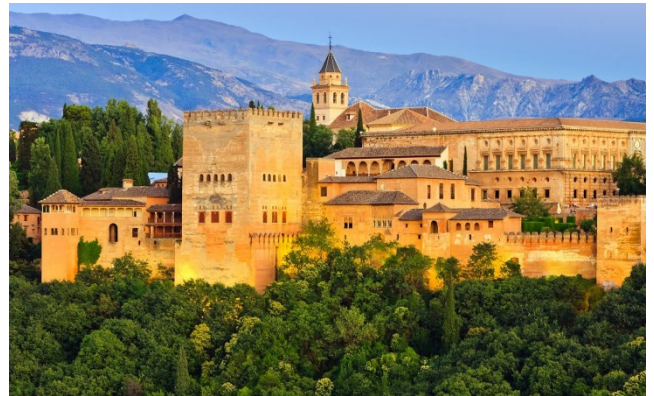
格拉那達阿罕布拉宮