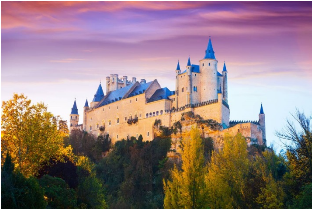
塞哥維亞阿爾卡乍城堡